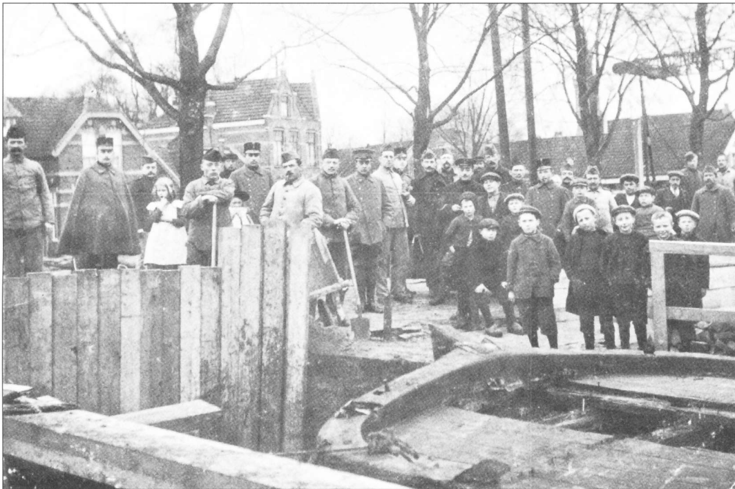
Grote belangstelling bij het afdammen